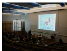
1. Conferencia inaugural en Reykjavik