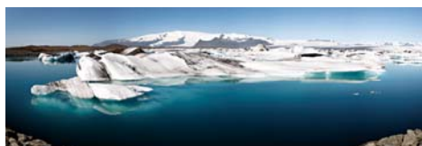
10. Icebergs en la lago proglaciar Jokullsarlon * y vehículo anfíbio usado en la visita