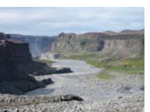
14. Cañón del río Jökulsá a Fjöllum