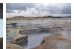
13. Sulfataras Hverarönd junto al lago Myvatn