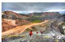
5. Landmannalaugar *