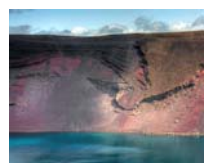
6. Brennisteinsalda *