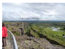
2. La dorsal en el parque Nacional de Thingvellir