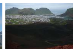
17. Coladas recientes en la isla Vestmannaeyri