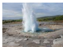
4. Erupción de un Geyser