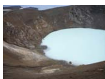
12. Caldera Viti en la gran caldera de Askja