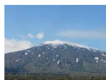
16. Volcán Snæfellness