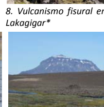
11. Volcán subglaciar Herthubreith