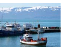
15. Observación de cetáceos desde Husavik