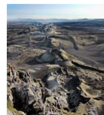
8. Vulcanismo fisural en Lakagigar*