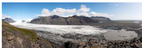
9. Lengua y frente del glaciar Skaftafell*