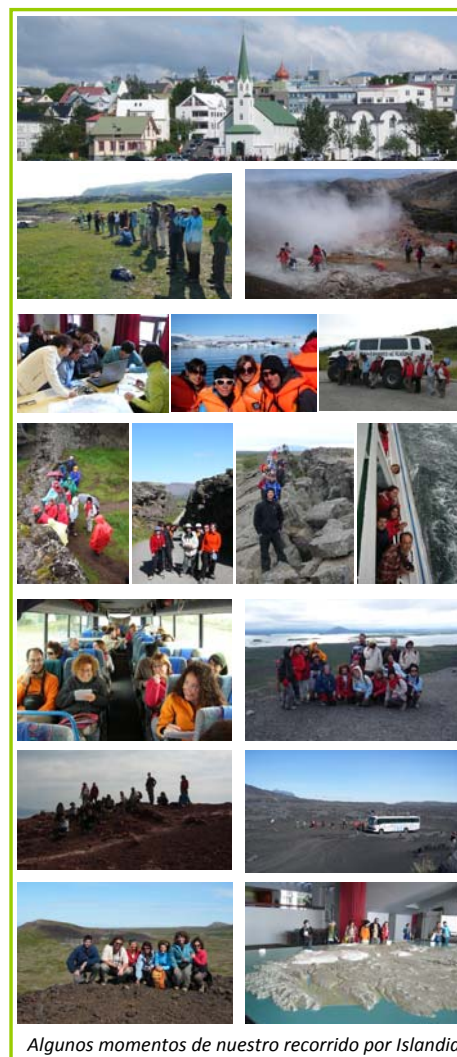
Algunos momentos de nuestro recorrido por Islandia