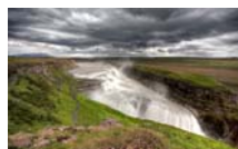
3. Cascada de Gullfoss*