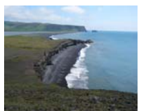
7. La costa sur desde Dyrhólaey